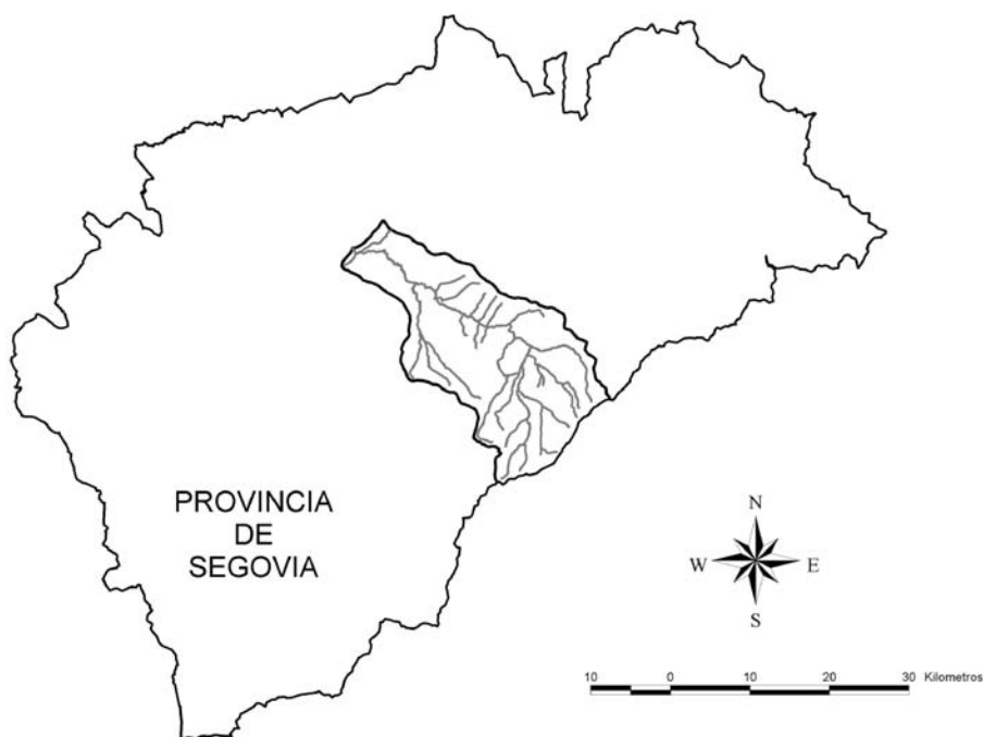
FIGURA 1: Situación general de la cuenca alta del río Cega (Segovia).

formación vegetal de pinar de Pinus pinaster dominante, entre la que aparecen salpicadas pequeñas superficies de cultivos.